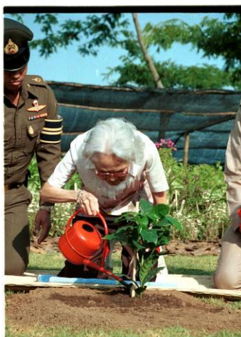
สมเด็จพระเจ้าทรงปลูกต้นกาแฟ ต้นแรก

ต้องเท้าความไปที่จุดเริ่มต้นของโครงการพัฒนาดอยตุงฯ สมเด็จพระเจ้าบรมวงศ์เธอ เจ้าฟ้าจุฑาธุชธราดัยราชกุมารี พระชนมายุ 90 พรรษา คุณลองคิดดูว่าจะเป็นยังไง ถ้าท่านประทับอยู่กรุงเทพฯ แล้วประทับอยู่เฉยๆ ไม่มีอะไรทำ ในฐานะผมเป็นราชเลขานุการ ต้องคิดว่าจะถวายท่านทรงทำอะไร เพราะท่านเชื่อแน่ว่าท่านยังสามารถทำประโยชน์ให้สังคมได้ สมเด็จพระเจ้าบรมวงศ์เธอ เจ้าฟ้าจุฑาธุชธราดัยราชกุมารี พระชนมายุ 900-1,300 เมตร จากระดับน้ำทะเลปานกลาง จะเหมาะสมที่สุดสำหรับพระองค์ท่าน เผอิญผมเจอ