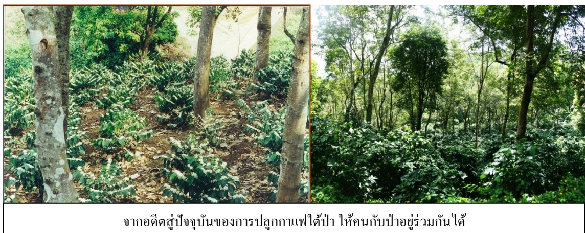
จากอดีตสู่ปัจจุบันของการปลูกกาแฟได้ป่า ให้คนกับป่าอยู่ร่วมกันได้