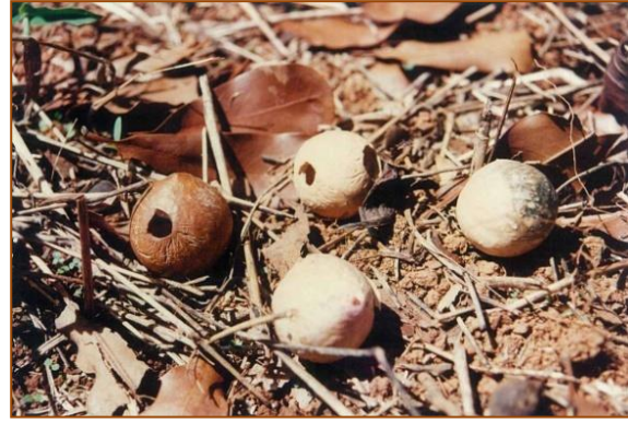
สภาพแมคคาเดเมียและกาแฟที่เสียหายจากสาเหตุต่างๆ

ผู้จัดการและเจ้าหน้าที่เดินนับและดูสภาพทุกต้น เพื่อแบ่งเกรด เดิน 6 แปลงที่ปลูกรวมประมาณ 3,600 ไร่ นับกาแฟอาราบิก้าได้ 832,000 ต้น แมคคาเดเมีย 83,000 ต้น ถึงได้รู้ว่ากาแฟและแมคคาเดเมียเราหายไปครึ่งหนึ่ง สาเหตุเพราะเราขาดความเข้าใจที่แท้จริง ขาดความรู้ วิธีการในการปลูก และขาดการติดตามดูแล ชาวบ้านมีความรู้แล้ว แต่ไม่ทำ ไม่ตัดแต่งกิ่ง ไม่ใส่ปุ๋ยตามที่ควรจะทำ คนดูแลก็ไม่ได้เดินตรวจพื้นที่ปลูก ปุ๋ยที่ให้ไป ใส่เท่าไร เอาไปไหนอีกเท่าไรไม่มีใครรู้ แต่การมานั่งดูแลและตรวจคุณภาพของต้นไม้เกือบล้านต้น 6 แปลงนี้ ไม่ใช่เรื่องง่าย ๆ ดังนั้น ต้องให้ความสำคัญเป็นอย่างมากกับการบริหารจัดการ