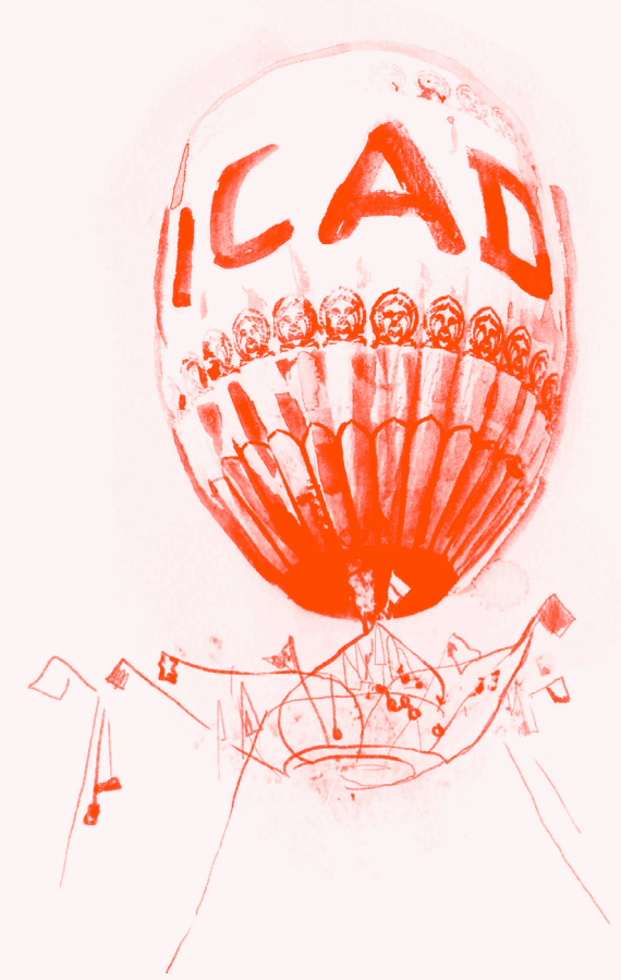
การประชุมระหว่างประเทศ ด้านการพัฒนาทางเลือก (ICAD2)

การพัฒนาไปสู่ชุมชนอื่นๆ มากยิ่งขึ้น นอกจากนี้ ปี 2558 ยังเป็นช่วงเวลาของการเปลี่ยนผ่านที่สำคัญ นั่นคือ การจัดทำเป้าหมายการพัฒนาที่ยั่งยืน (SDGs) ของสหประชาชาติเพื่อการพัฒนาในอีก 15 ปีข้างหน้า และการจัดงานการประชุมสมัชชาสหประชาชาติสมัยพิเศษว่าด้วยเรื่องปัญหาอาชญากรรมเสพติดโลก (UNGASS) ที่จัดขึ้นในปี 2559 เพื่อทบทวนนโยบายด้านยาเสพติด ในช่วงเวลาสำคัญนี้ มูลนิธิแม่ฟ้าหลวงฯ ขอตั้งมั่นที่จะดำรงความเป็นผู้นำด้านการปฏิบัติแนวทางการพัฒนาทางเลือก และผลักดันเชิงนโยบายเพื่อให้เกิดประโยชน์กับชุมชนที่ขาดโอกาสอย่างแท้จริง