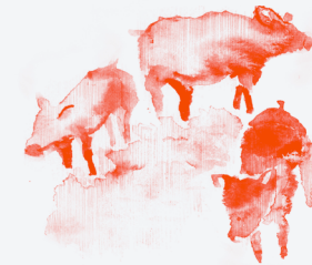
"ใช้ทรัพยากรเลี้ยงชีพตัวเอง ได้อย่างพอเพียง"

เราเป็นเจ้าของที่นี่ ถ้าเราไม่ร่วมกันจัดการทรัพยากรป่ากันเอง ถ้าเราให้คนใดคนหนึ่งมาเป็นผู้บริหารจัดการ มันไม่ได้ เจ้าหน้าที่ของรัฐกับชุมชนต้องร่วมกัน บูรณาการร่วมกัน ป่าก็จะเขียว พอป่ามีความสุข ชาวบ้านก็มีความสุข เจ้าหน้าที่ดูแลชุมชนก็จะสบายใจ และปีนี้บ้านน้ำช้างได้คืนพื้นที่ทำกินให้เป็นป่า 2,000 กว่าไร่ ตอบสนองนโยบายเพื่อคนกรุงเทพฯ เพราะเราคิดจะสร้างต้นน้ำให้คนกรุงเทพฯ ถ้าเราทำกันทั้งหมด ให้เป็นนโยบายของรัฐบาล คนกรุงเทพฯ จะมีความสุข เพราะไม่มีภัยน้ำท่วมและสารเคมี