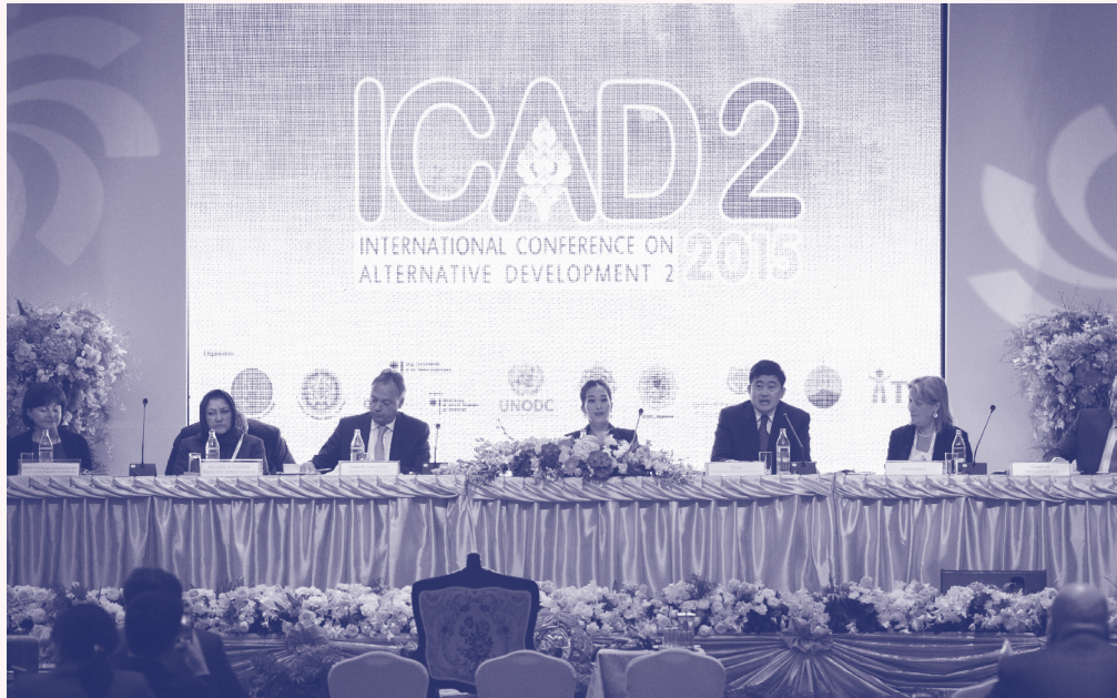
“พระองค์เจ้าพัชรกิติยาภา ทรงเป็นองค์ประธานในการประชุม”

ตลอดระยะเวลากว่า 10 ปี มูลนิธิแม่ฟ้าหลวงฯ เป็นหน่วยงานสำคัญที่นำแนวทางการพัฒนาทางเลือกไปปฏิบัติจริง พร้อมทั้งผลักดันเรื่องการพัฒนาอย่างยั่งยืนและครบวงจรที่ยึดคนเป็นศูนย์กลางสู่การปฏิบัติในทุกพื้นที่ ตั้งแต่พื้นที่ปลูกพืชเสพติด รวมถึงพื้นที่ที่ประสบปัญหาความยากจนและเสี่ยงภัยต่างๆ ปี 2558 เป็นปีสำคัญที่มูลนิธิแม่ฟ้าหลวงฯ เริ่มต้นความร่วมมือกับรัฐบาลเยอรมนีในฐานะหุ้นส่วนสำคัญในการสร้าง Global Partnership for Drugs and Development Policies (GPDDP) ซึ่งเป็นช่องทางในการเชื่อมความเชี่ยวชาญด้านการพัฒนาของไทยและการสนับสนุนของเยอรมนี เพื่อเป็นที่ปรึกษาและให้คำแนะนำด้านการพัฒนาทางเลือกให้รัฐบาลต่างๆ และขยายผล