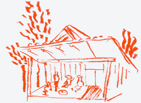
"คนกรุงเทพฯ จะมีความสุข เพราะไม่มีภัยน้ำท่วมและสารเคมี"